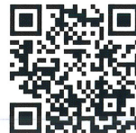
症例動画 (ブリッジ)