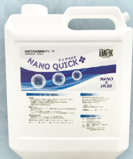
◆4000cc (詰め替え用) 商品コード：19303 標準価格：18,000円