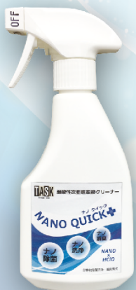
◆400cc (スプレータイプ) 商品コード：19301 標準価格：3,000円